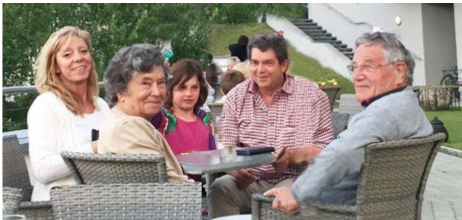
Familie Ingensand und das Zeter Berghaus Team