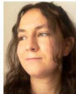
Jana Krämer Service