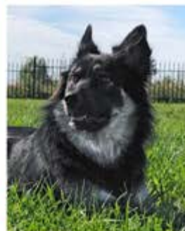
Malia Ingensand Resteverwertung