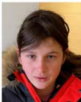
Kaya Ingensand Service